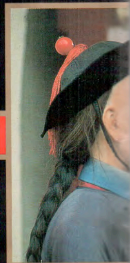
Gardien du Temple du ciel

Née sous le signe de la chance, vous savez, de plus, quand et comment la saisir, parfois au risque de choquer. Persévérante, intelligente, passionnée, vous menez à bien ce que vous entreprenez. Sûre de vous, vous ne redoutez guère que la solitude, et c'est avec acharnement que vous recherchez l'être aimé, qui devra obligatoirement sortir de l'ordinaire. Plus femme d'extérieur que d'intérieur, vous privilégiez l'action et la vitalité à la douceur d'un foyer.