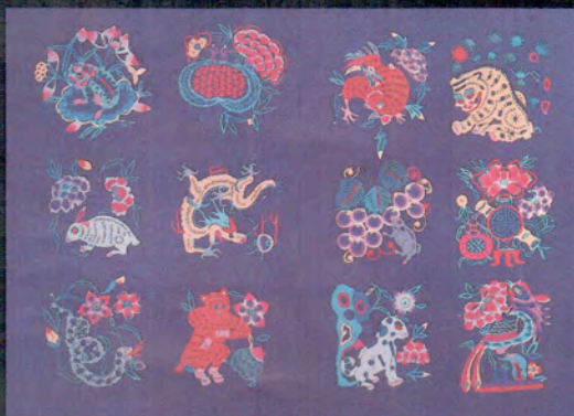
Bestiaire chinois en papier couleur

Regardez-vite le signe de votre année de naissance et découvrez, dans les pages qui suivent, quelques traits de votre personnalité !