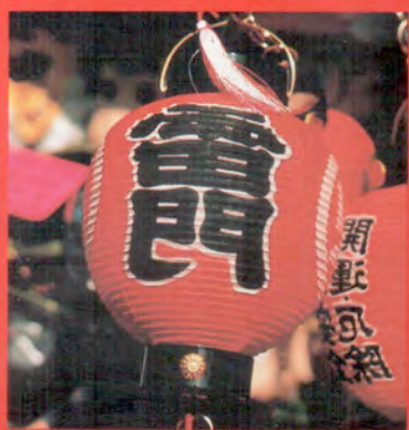
En rouge et noir : des lanternes chinoises

le nom signifie "relève des années", ils permettent d'exprimer les différentes formes de bonheur à venir. Fourrés d'une cacahuète ou d'un marron, ils sont alors signe de longévité ou de naissance d'un garçon... Mieux vaut être vigilant au moment de se servir !