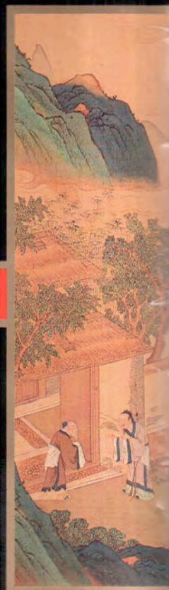
Vie des empereurs chinois

Lorsqu'il arrive, en 1275, à la cour de Kubilay Khan, MARCO POLO n'en croit pas ses yeux : cinq mille astrologues craints et respectés y vivent et interprètent les messages célestes. Ils perpétuent ainsi- avec des méthodes différentes, mais dans le même esprit- l'art de la divination tel qu'il se pratiquait sous la dynastie Shang, du XIV e au XI e siècle avant notre ère, à l'aide d'ossements et d'écailles de tortue. Du bas peuple à l'entourage de l'empereur, tout le monde les consulte avant de prendre une décision car il importe à chacun de se soumettre à l'ordre de l'univers. Astrologues d'hier et d'aujourd'hui, ni mathématiciens ni philosophes, ces savants chinois ne cherchent pas à expliquer le monde, mais simplement à s'y adapter au mieux et à y vivre en harmonie. Interdite actuellement en Chine Populaire, la profession d'astrologue est cependant toujours reconnue et respectée par de nombreux chinois qui font établir leur horoscope en secret.