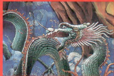
Un dragon au jardin du Tigre - Hong Kong

Eventails, banderoles, lanternes en forme de dragon, et combats traditionnels accompagnent joyeusement toutes ces danses.