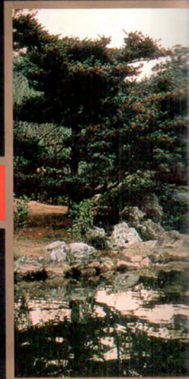
Le Pavillon des Pivoines