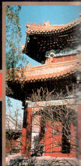
Le Temple des lamas à Pékin

Sachant plaire, d'une grande vivacité d'esprit et dotée de sens critique, vous êtes "la femme spirituelle". Fidèle et exigeante en amitié, vous l'êtes plus encore en amour : amoureuse à la folie, sans demi-mesure, vous voulez partager votre amour passion avec un homme complice qui vous comprend et vous surprend. Intelligente et talentueuse, vous négligez les emplois médiocres... tout autant que les soucis financiers. Dur dilemme !