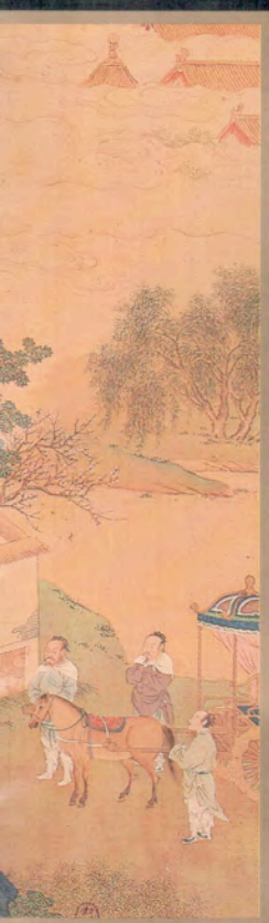
maestrie des Han